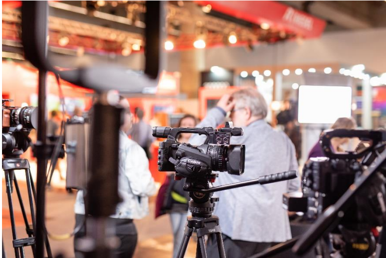
Der Image Creation Hub bietet Produktinnovation, Weiterbildung, Networking und vieles mehr.